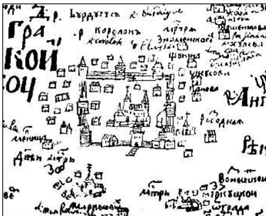
Чертеж земли Иркутского города. Фрагмент из «Чертежной книги Сибири» С. Ремезова. 1701 г.

Наглядное представление о заселении и развитии территории по состоянию на начало XVIII в. дает чертеж земли Иркутского города, помещенный в «Чертежной книге Сибири», составленной в 1701 г. тобольским служилым человеком Семеном Ремезовым. Согласно данному чертежу Иркутск являлся самым крупным городом уезд. В его центре изображена деревянная острожная крепость, имеющая восемь башен; внутри острога – воеводская изба и иные постройки. С трех сторон к Иркутскому острогу примыкали посадские дома. На р. Ушаковке обозначена мельница; за ней – Знаменский женский монастырь (впоследствии – Знаменское, Маратовское предместье Иркутска). На левом берегу Ангары отмечены деревня Могилева и Иркутский Вознесенский монастырь (впоследствии – Глазковское предместье Иркутска, район Свердлово). 4