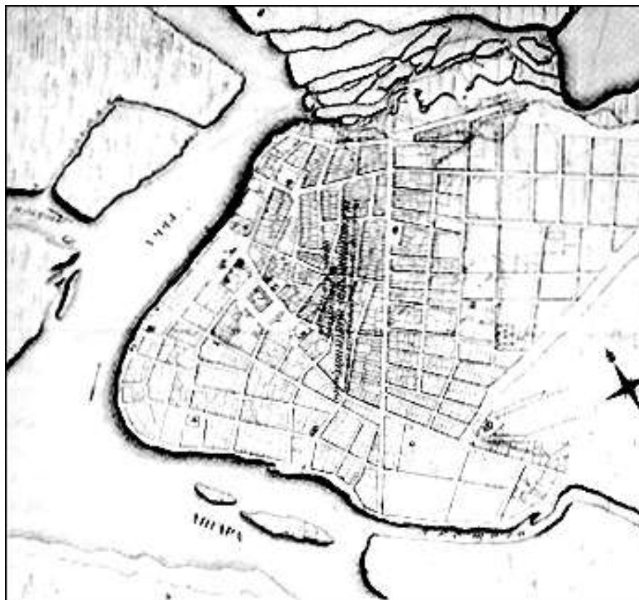
Генеральный план губернского города Иркутска 1792 г. (фрагмент). РГИА. Ф. 1399. Оп. 1. Д. 354.

С начала XIX в. по начало XX в. городская архитектура Иркутска была связана с типовыми образцами домов, определяемых соответствующими органами государственной власти. Для этого были созданы пять гравировальных альбомов с чертежами фасадов, которые соответствовали канонам русского классицизма. Цель такой акции состояла в том, чтобы придать единство застройке и создать определенную стилистику городу.