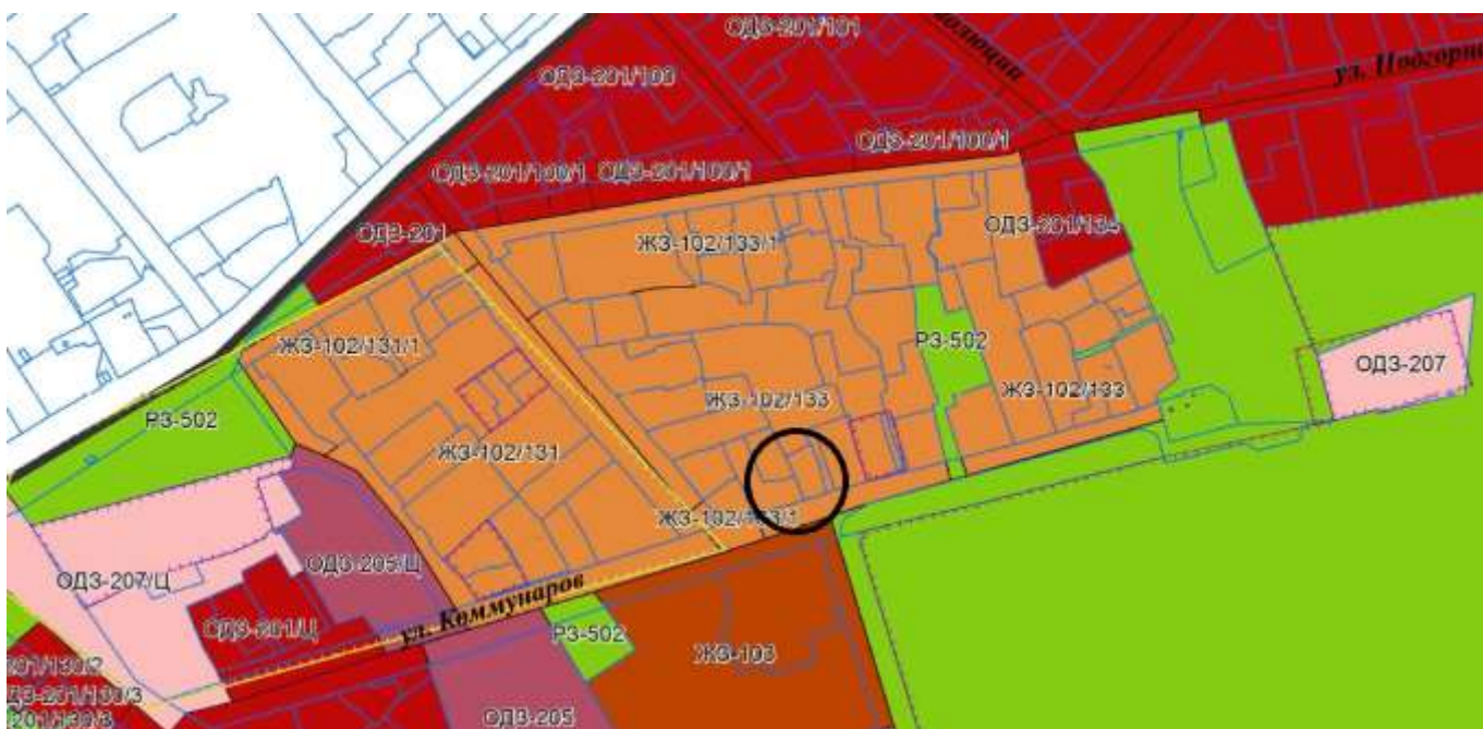
Месторасположение исследуемого Объекта на Карте градостроительного зонирования Правил землепользования и застройки территории города Иркутска

К основным видам разрешенного использования территорий в территориальной зоне «ЖЗ-102/133/1 – Зоны застройки малоэтажными многоквартирными жилыми домами (до 4-х эт.)» относятся: размещение малоэтажных многоквартирных домов (многоквартирные дома высотой до 4 этажей, включая мансардный); обустройство спортивных и детских площадок, площадок для отдыха; размещение объектов обслуживания жилой застройки во встроенных, пристроенных и встроенно-пристроенных помещениях малоэтажного многоквартирного дома, если общая площадь таких помещений в малоэтажном многоквартирном доме не составляет более 15% общей площади помещений дома.