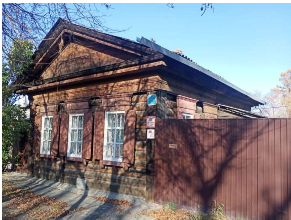
«Дом жилой по ул. Коммунаров, д. 13»

Уточненный адрес Объекта в соответствии с Федеральной информационной адресной системой (ФИАС): Иркутская область, городской округ город Иркутск, город Иркутск, улица Коммунаров, дом 13.