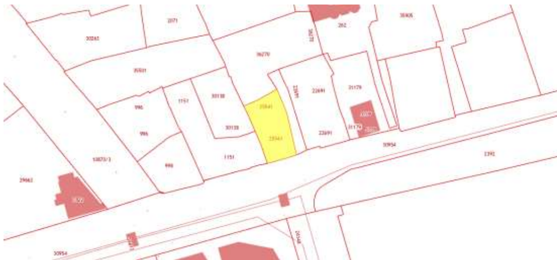
Сведения о земельном участке, на котором расположен Объект (по данным Публичной кадастровой карты https://pkk5.rosreestr.ru )

По данным Росреестра, исследуемая территория по адресу: Иркутская область, г. Иркутск, ул. Коммунаров, д. 13, лит. А, а, а1, на котором расположен Объект, находится на земельном участке с кадастровым номером: 38:36:000021:25541 в кадастровом квартале: 38:36:000021. Категория земель: земли населенных пунктов; статус: учтенный; разрешенное использование: для эксплуатации индивидуального жилого дома со служебно-хозяйственными строениями; площадь: 328 кв. м.