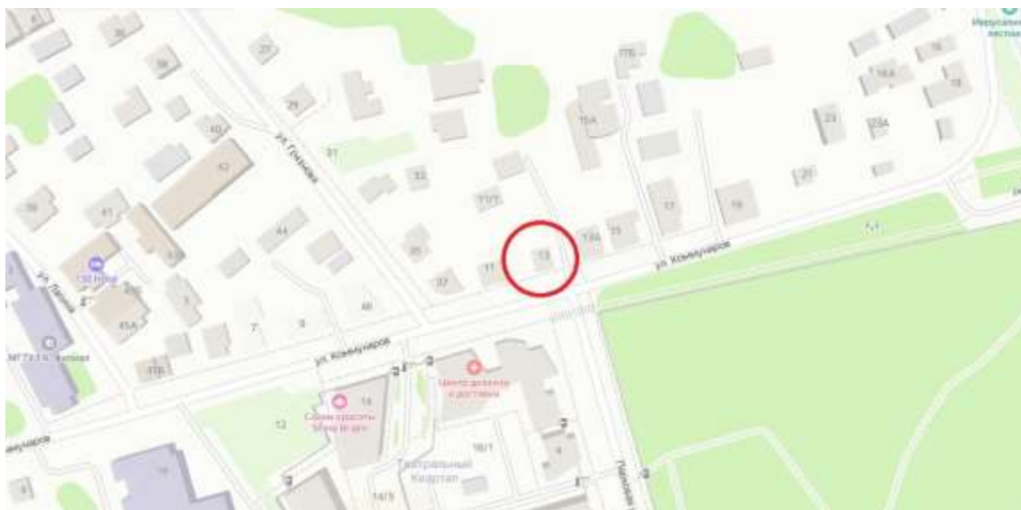
Ситуационный план расположения Объекта в городе Красноярск. Яндекс.Карты.

В советское время исследуемая территория месторасположения Объекта продолжала сохранять жилой характер. На месте кладбища на Иерусалимской горе был открыт Центральный парк культуры и отдыха.